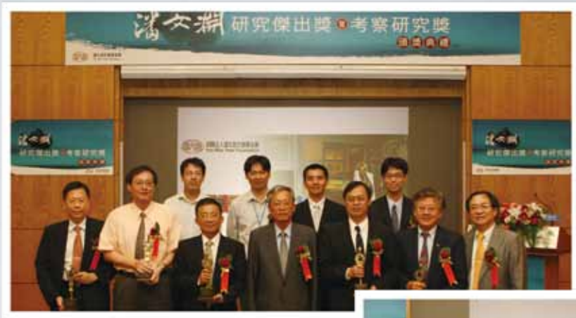
▲ 研究傑出獎暨考察研究獎頒獎典禮