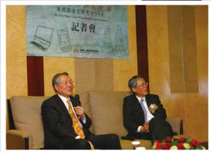
▲ 第四屆潘文淵獎頒獎典禮記者會