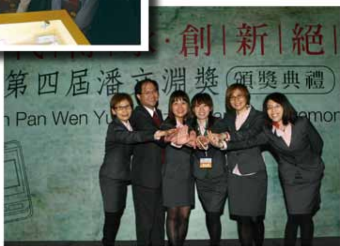
▲ 潘文淵獎頒獎典禮會務人員合影