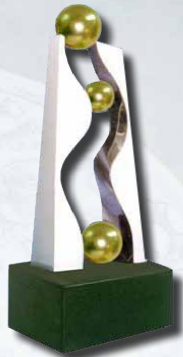
潘文淵獎座由楊奉琛先生所設計，以潘文淵先生之名諱「淵」字作造型架構，一方面感念潘文淵先生對電子工業的關懷與貢獻，一方面亦以形象文字意象代表作品意涵，三顆向上攀升之金球為水之示意，不鏽鋼山水造型為淵之表象，表達其具有開拓、向前邁進追求卓越的精神。

2010 潘文淵獎頒獎典禮於 2010 年 12 月 28 日假台北遠東國際飯店舉辦，蕭萬長副總統特別出席，除表達對國內科技產業的重視，同時肯定本獎項為台灣科技界之「諾貝爾獎」，並期望政府能與各界菁英一起努力，共同再創我國科技產業美好的前景！