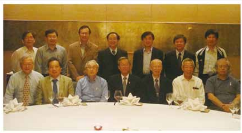
▲ 第六屆第一次董事會議