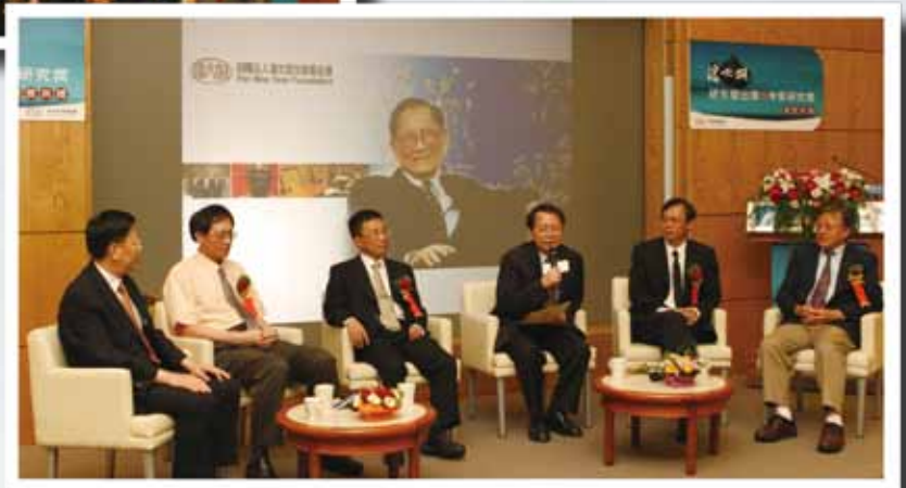
▲ 清大陳力俊校長主持五位傑出研究獎得獎人高峰論壇