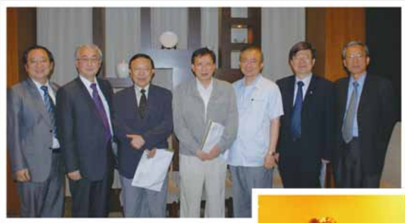
▲ 劉兆玄召集人召開潘文淵獎評審會議