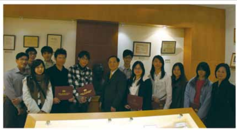
▲ 獎學金獲獎學生聯誼茶會