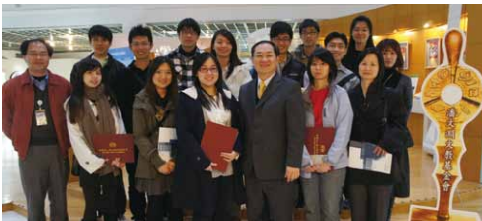
台灣得獎學生及家長與本會人員於工研院展示館合影

本基金會除持續扮演一個平台的角色，未來還會舉辦兩岸學生交流等相關活動，相關訊息會公佈在基金會之網頁，以及透過各校生輔組公佈，非常歡迎各位得獎人能參與。本基金會將支付活動費用，讓臺灣得獎學生們與對岸也是鑽研相關科技領域的學生互動交流。