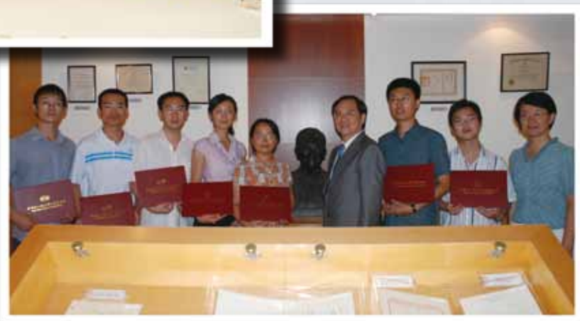
▲ 兩岸交大菁英交流