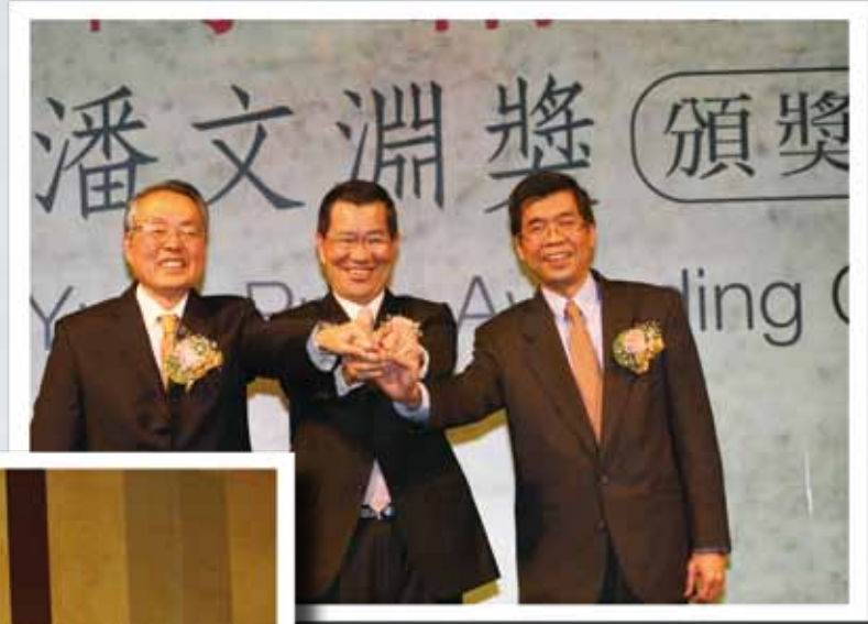
▲ 蕭萬長副總統與2位得獎人合影